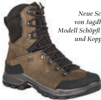
Neue Schuhe von Jagdhund: Modell Schöpfl 1 (o.) und Koppl (u.).