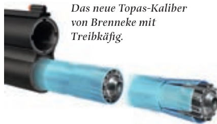
Das neue Topas-Kaliber von Brenneke mit Treibkäfig.