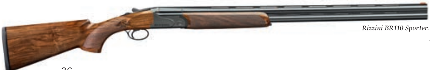
Rizzini BR110 Sporter.