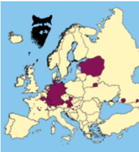
Waschbär: bekannte Verbreitungsgebiete

lation in Europa lebt in Mitteldeutschland. Sie ist auf nur zwei Waschbärpaare zurückzuführen, die 1934 mit Genehmigung der zuständigen Jagdbehörde in der Nähe der hessischen Stadt Kassel ausgesetzt wurden. Als Kulturfollower sind die Waschbären mittlerweile auch in Siedlungsgebiete vorgedrungen und erreichen dort Dichten von bis zu 100 Individuen auf 100 ha. Sie ernähren sich von Abfällen und verwüsten als unerwünschte Untermieter so manchen Dachboden. Weitere meist gezielte Einbürgerungen des Waschbären haben in Weißrussland und im Kaukasus stattgefunden sowie in Japan, wo man sich lästig gewordener Haustiere durch Freisetzung entledigte. Die heutigen Waschbärbestände in Ostdeutschland und in Nordfrankreich könnten als Kriegsfolgen bezeichnet werden. Sie entstanden durch die Zerbombung einer Pelztierfarm bzw. sind die Hinterlassenschaft amerikanischer Soldaten, die Waschbären als Maskottchen hielten. In Deutschland wird der Waschbär heute als heimisch betrachtet und ist nahezu flächendeckend verbreitet. Im Jagdjahr 2004 wurden über 23.000 Waschbären erlegt, wobei eine Verzehnfachung der vorher konstanten Abschusszahlen erst Mitte der 1990er Jahre einsetzte. Auch in den Nachbarländern Deutschlands mehren sich die Waschbärnachweise. In Österreich ist er seit Mitte der 1970er Jahre bekannt, scheint bisher aber noch keine nennenswerten Dichten erreicht zu haben. Bis 2001 zusammengetragene Nachweise stammen insbesondere aus Vorarlberg,