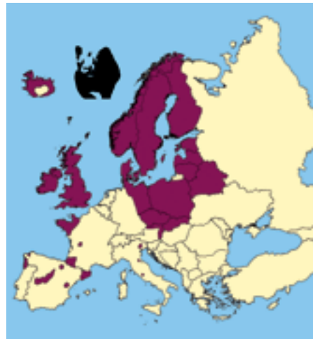
Mink: bekannte Verbreitungsgebiete

lation in Europa lebt in Mitteldeutschland. Sie ist auf nur zwei Waschbärpaare zurückzuführen, die 1934 mit Genehmigung der zuständigen Jagdbehörde in der Nähe der hessischen Stadt Kassel ausgesetzt wurden. Als Kulturfollower sind die Waschbären mittlerweile auch in Siedlungsgebiete vorgedrungen und erreichen dort Dichten von bis zu 100 Individuen auf 100 ha. Sie ernähren sich von Abfällen und verwüsten als unerwünschte Untermieter so manchen Dachboden. Weitere meist gezielte Einbürgerungen des Waschbären haben in Weißrussland und im Kaukasus stattgefunden sowie in Japan, wo man sich lästig gewordener Haustiere durch Freisetzung entledigte. Die heutigen Waschbärbestände in Ostdeutschland und in Nordfrankreich könnten als Kriegsfolgen bezeichnet werden. Sie entstanden durch die Zerbombung einer Pelztierfarm bzw. sind die Hinterlassenschaft amerikanischer Soldaten, die Waschbären als Maskottchen hielten. In Deutschland wird der Waschbär heute als heimisch betrachtet und ist nahezu flächendeckend verbreitet. Im Jagdjahr 2004 wurden über 23.000 Waschbären erlegt, wobei eine Verzehnfachung der vorher konstanten Abschusszahlen erst Mitte der 1990er Jahre einsetzte. Auch in den Nachbarländern Deutschlands mehren sich die Waschbärnachweise. In Österreich ist er seit Mitte der 1970er Jahre bekannt, scheint bisher aber noch keine nennenswerten Dichten erreicht zu haben. Bis 2001 zusammengetragene Nachweise stammen insbesondere aus Vorarlberg,