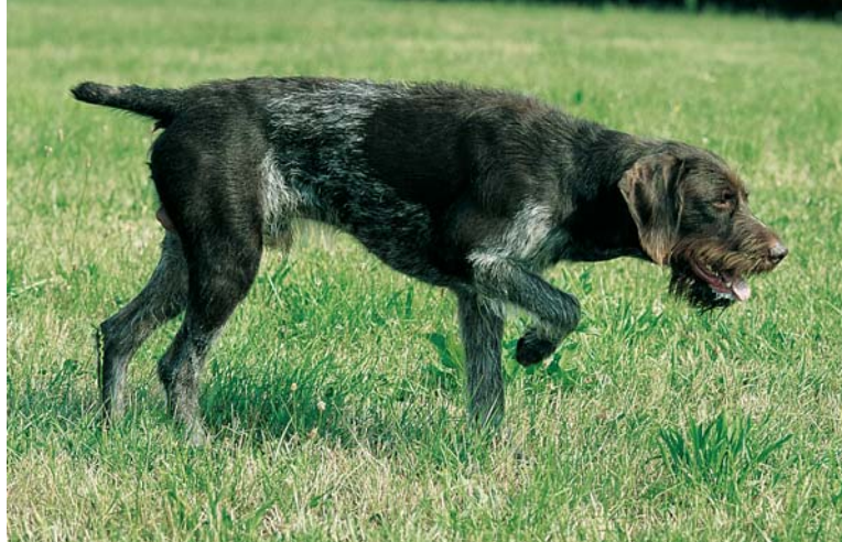
Beim Deutsch Drahthaar kommen verschiedene Farbschläge vor, zum Beispiel Braunschimmel mit Platten ...