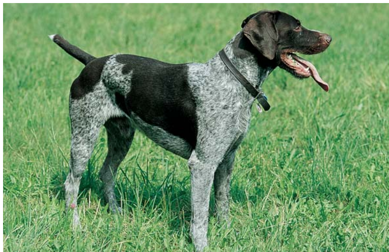
Von weitem kann der Deutsch Drahthaar unter Umständen mit dem Deutsch Kurzhaar verwechselt werden