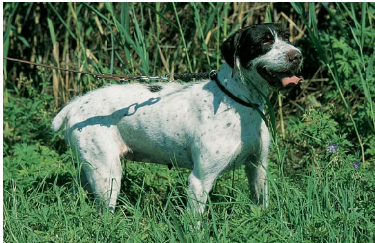
... oder Hellschimmel